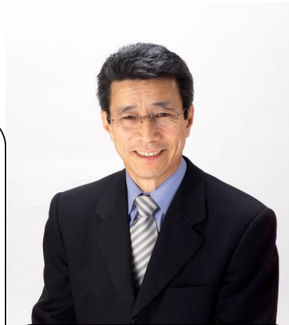
豊橋市議会議員 寺本 ひろゆき