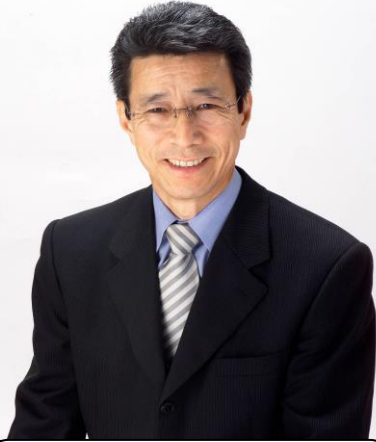
豊橋市議会議員 寺本 ひろゆき