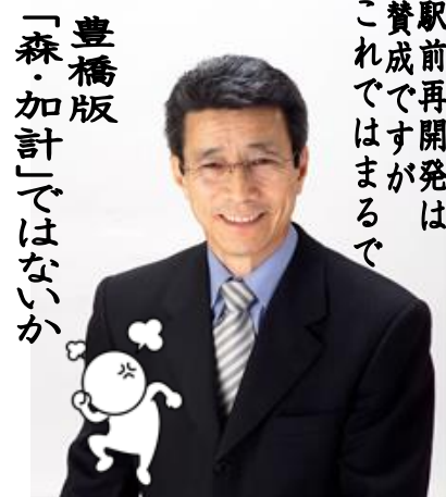
豊橋市議会議員 寺本 ひろゆき