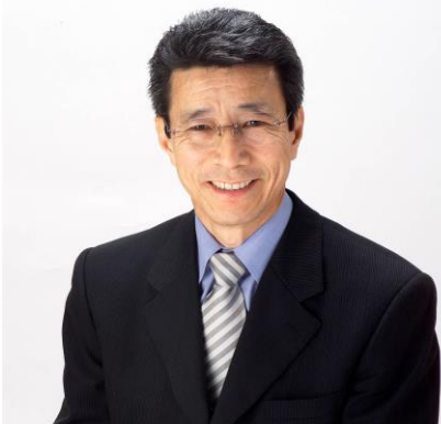
豊橋市議会議員 寺本 ひろゆき