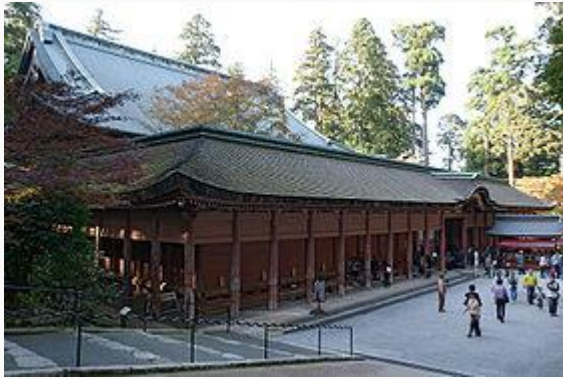
延暦寺 根本中堂 (国宝) と回廊