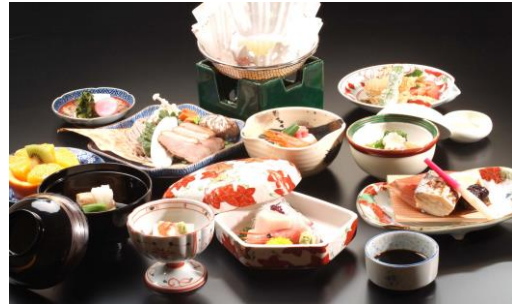
琵琶湖グランドホテルの昼食イメージ写真

同封しましたチラシにありますように、親睦バスツアーを開催します。今年で紘基会は設立6周年を迎えました。この記念も兼ねて行います。みなさまお誘いあつてご参加ください。車中では大いに語り合い、親睦を深めましょう。