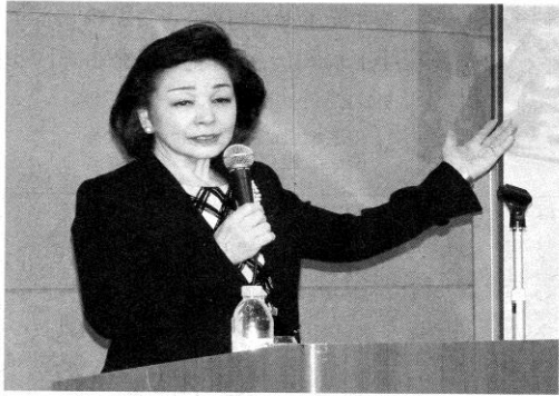
拉致問題と日本外交について持論を語る 櫻井氏―豊川市民プラザで

北朝鮮による拉致問題 解決を呼び掛けるブル リボン豊川(八木月子代 表)は11日、豊川市民プ ラザ(諏訪3)で講演会 「櫻井よしこ氏・拉致問 題の今を語る。」を開い た。