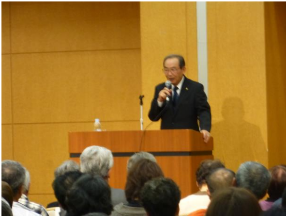
(写真:挨拶する豊川市長と寺本)